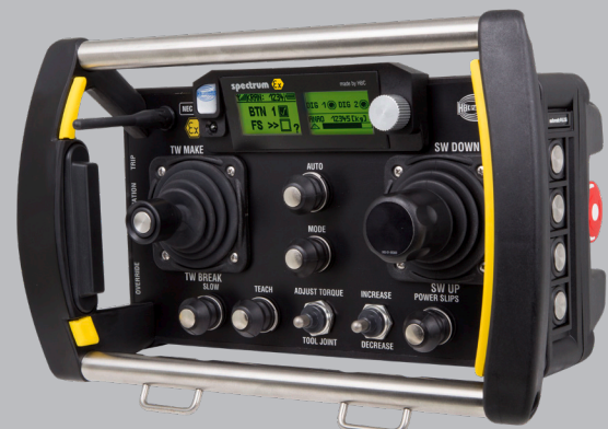
Version mit Meisterschalter, Z-Achsen-Schalter, Zustimmung-Taster und verschiedenen weiteren Bedienelementen.