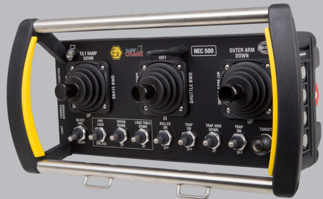
Version mit 3 Meisterschaltern und verschiedenen weiteren Bedienelementen.

Verschiedenste Krane und Maschinen in explosionsgefährdeten Arbeitsbereichen.